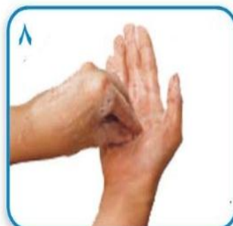
۸ مالش های مدور و رفت و برگشتی با انگشتان بسته یک دست روی کف دست دیگر و بالعکس