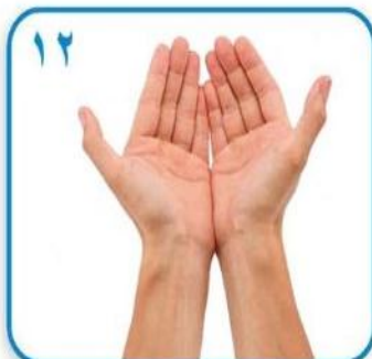
۱۲ اکنون دستهای شما کاملا تمیز و مطمئن هستند