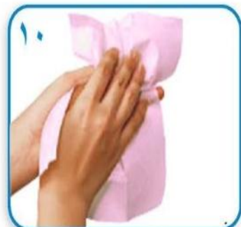
۱۰ با یک دستمال حوله ای بطور کامل خشک کنید