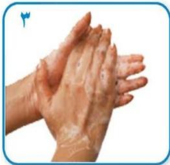
۳ کف دست ها را به هم بمالید