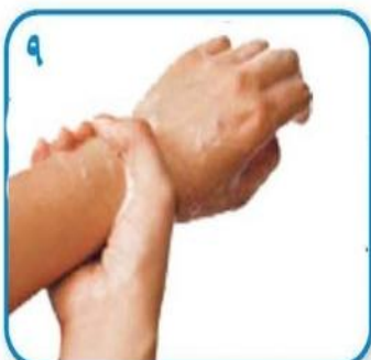
۹ مچ دستها را کاملا آبکشی نمایید