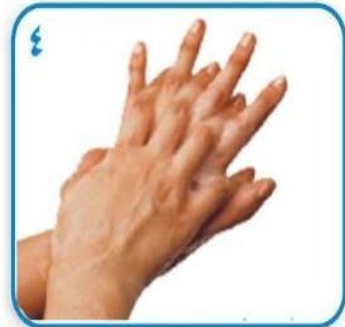
۴ کف دست راست بر پشت دست چپ با انگشتهای درهم و بالعکس