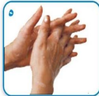
۵ مالیدن کف دستها با انگشتهای درهم