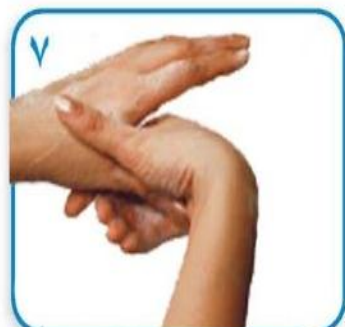
۷ مالش گردشی شست یک دست در داخل کف دست دیگر و بالعکس