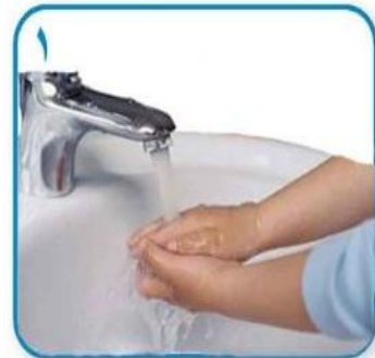
۱ دستها را با آب خیس کنید