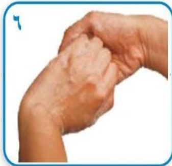
۶ پشت انگشت ها را داخل کف دستها ببرید تا در هم قفل شوند