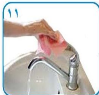
۱۱ از همان دستمال برای بستن شیر آب استفاده کنید