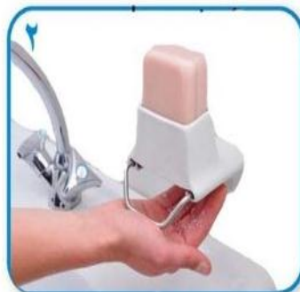
۲ صابون کافی برای پوشاندن سطح دستها بردارید